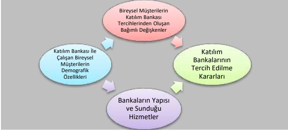
Şekil 1: Araştırma Modeli